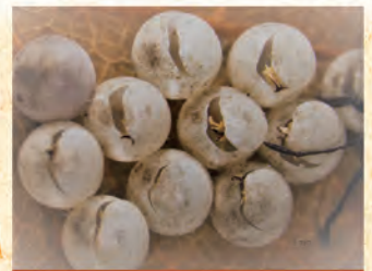
正常孵化的卵孔-長裂縫狀