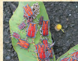
二至五齡若蟲體色橙紅具黑外框，狀如長方形撲克牌。