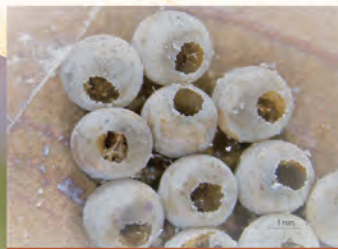
平腹小蜂羽化的卵孔-圓單孔狀

藥劑防治建議於清晨或傍晚進行，成蟲活動力較低。可依當年的氣候溫度(約1至2月下旬)，越冬的成蟲開始活動聚集於嫩梢時，進行第一次的施藥防治，於3月中旬後因成蟲活動力強，藥劑防治效果不佳，且已進入開花期，此時不建議用藥，以避免誤傷蜜蜂等授粉昆蟲，待至花期結束開始結小果後之荔枝細蛾防治階段，同時防治於葉背的荔枝椿象若蟲；用藥時請上網查詢防檢局公告核准藥劑。