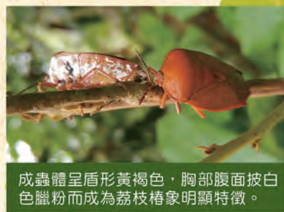
成蟲體呈盾形黃褐色，胸部腹面披白色蠟粉而成為荔枝椿象明顯特徵。