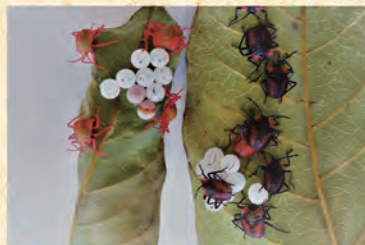
初孵化之一齡若蟲，體長0.5公分呈紅色長橢圓形，後則轉黑。